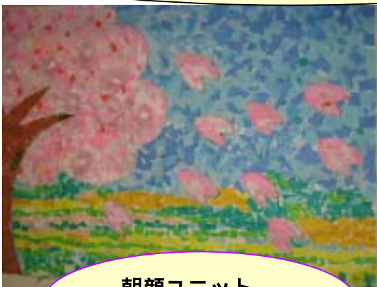
朝顔ユニット 入所者による貼り絵